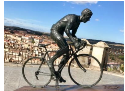
De adelaar van Toledo: Frederico Bahamontes