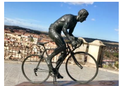
El águila de Toledo: Frederico Bahamontes